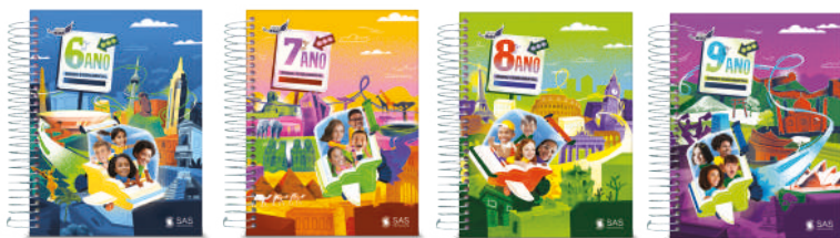
Livro principal integrado com todas as disciplinas (3 volumes/série)

Destinada aos alunos das séries finais do Ensino Fundamental, a Coleção é composta pelos componentes: Língua Portuguesa, Língua estrangeira (para o 9º ano), Matemática, História, Geografia, Ciências (Física, Química e Biologia para o 9º ano), além de diversos materiais suplementares.