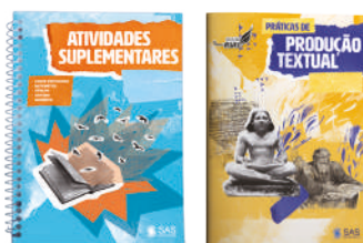
6º ao 9º ano

Soluções que ampliam as experiências da coleção