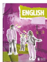
Livro único (9º ano)

Soluções que ampliam as experiências da coleção